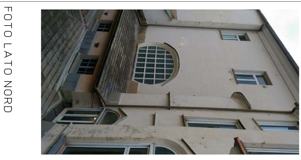
FOTO LATO NORD